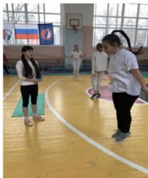
Прыжки на скакалке за 15 секунд.